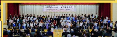
全校合唱 「With You Smile」 「ありがとうの花」