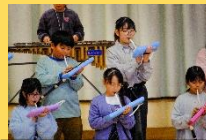
4年 音楽万博へ ようこそ