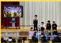
2年 尾駈大すき おおむすび