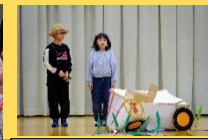
5年 総合学習発表 ～お米の果てまでイッテQ!～