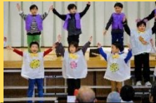
1年 おおむすびころりん くるくるりん