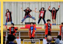
3年 おぶちっ子 フェスティバル!!