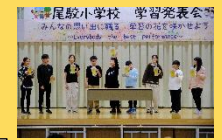
6年 もしもし未来? 20年後の僕ら