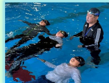
↑ 着衣泳で水の事故から身を守る