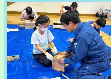
↑ 4年:森林の学習と木工体験