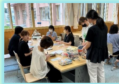
↑ 図書支援委:新刊図書の整理