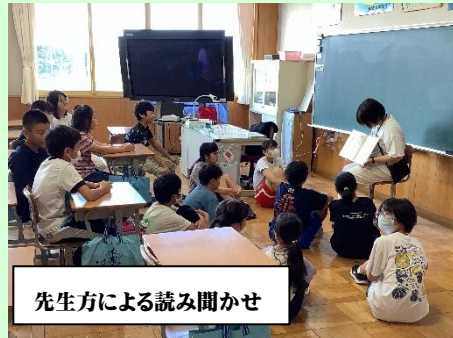
先生方による読み聞かせ

見たことのない世界に空想を広げていました。また、知りたい言葉や情報を調べるのも辞書や図鑑、事典を使って調べていました。