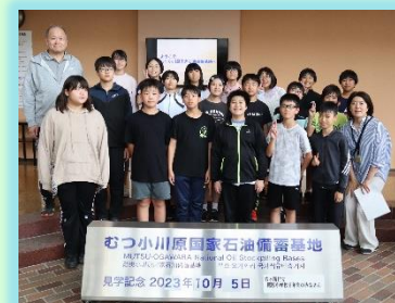
↑ 6年:石油備蓄基地見学