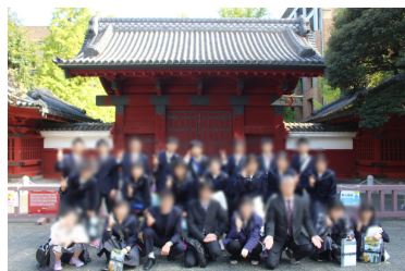
東京大学赤門 もとは百万石といわれた旧加賀藩前田氏が将軍の娘を正室に迎えるために建立した御守殿門

に昇りました。展望台に昇るエレベーターはたくさんの観光客でにぎわっており、特に外国人観光客が多いように見えました。展望台では、ガラスばりになっている床からの眺めを恐る恐るのぞいている人もいました。2日目は、ほとんどが電車での移動でした。警視庁では、通信指令センターの見学などを行いました。通信指令センターは、都民からの110番を受理するところで、1日に平均4500