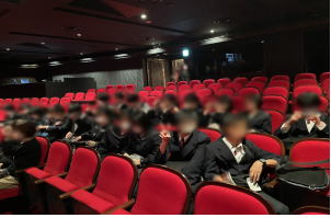
劇団四季劇場内の様子