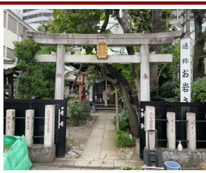
田宮稲荷神社(於岩神社) 明治期に火事で焼失し一時別の場所に移設したものを再建