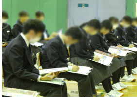
3年生生徒のお招きし、立六ヶ所高等学校をはじめ、4校の先生方を招き、3年生生徒

3学年では、11月2日(木)の放課後、保護者を対象とした進路説明会を実施しました。