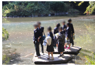
東京大学「三四郎池」