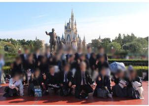
東京ディズニーランド

刻には、お互いに買ったキャラクター商品を見せ合う姿が見られました。デイズニールン