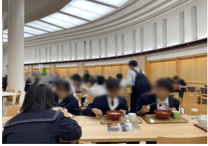
東京大学学生食堂