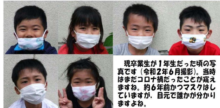
現卒業生が1年生だった頃の写真です(令和2年6月撮影)。当時はまだコロナ禍だったことが窺えますね。約6年前かつマスクはしていますが、目元で誰かが分かりますよね。

3月19日には、『令和7年度卒業証書授与式』を挙行し、6名の卒業生が本校を巣立って行きました。上述のように、3・6年後には立派な中学3年生・高校3年生に、その後も立派な大学生・社会人になってくれるものと信じています。そんな子どもたちの成長の過程に、たった3年間ですが関わったことをうれしく